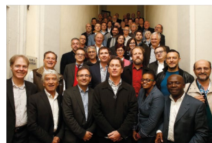
Congreso del CIAM en Siena (Italia), 2015