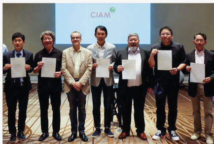
Participantes en Bangkok, mayo 2016